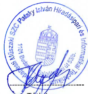
Tóth Imre iskola igazgató